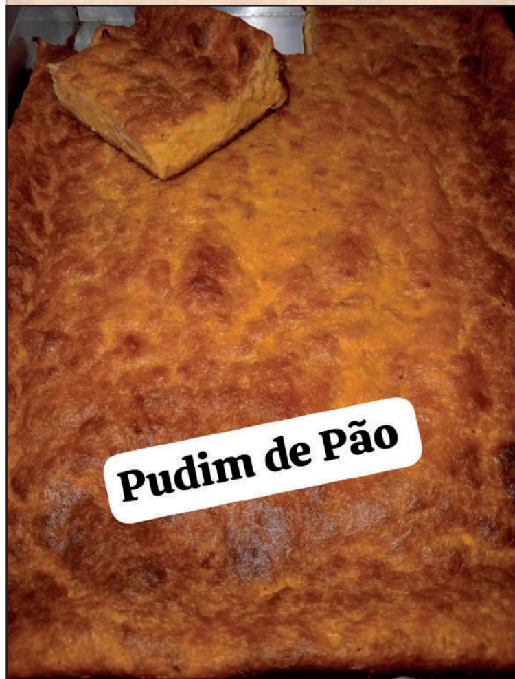
Pudim de Pão