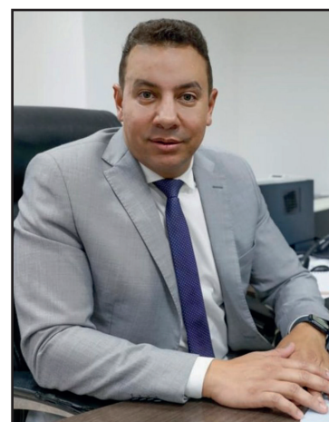
Wenderson Teles, Secretário de Estado de Administração Penitenciária

dentro do próprio presídio com auxílio do GDF Presente, para que o material possa chegar à granulometria de resistência e cálculo de cimento necessários para a durabilidade. O diretor de Suporte Operacional da Seape, Hugo Azevedo, acredita que o projeto ajuda na capacitação dos internos, ao mesmo tempo que beneficia a cidade. “Brasília estava