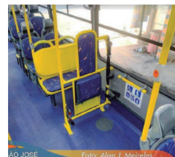
AO JOSÉ

O pleito foi atendido! Uma nova frota de ôni-