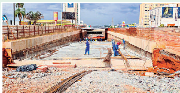
Evolução da obra está dentro do cronograma definido pelo GDF.