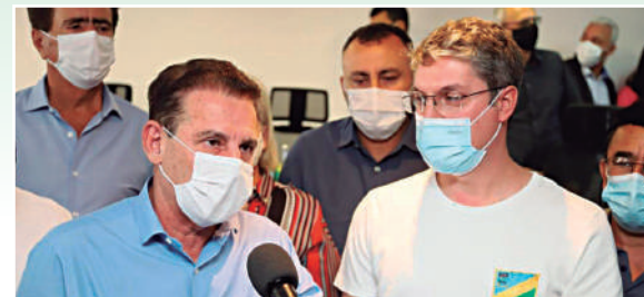
São recursos para a construção de uma maternidade, pavimentação e aquisição de máquinas motoniveladoras.