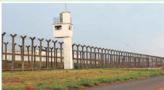
Leila Cury tomou decisão após surto de gripe e aumento significativo nos casos de covid.